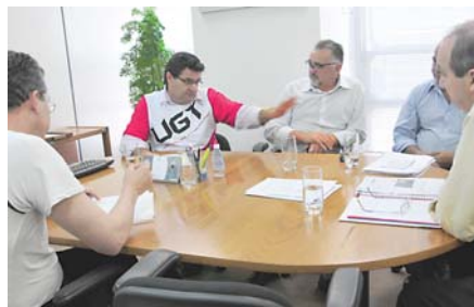
Reunião do Singuesp com a CET e DSV