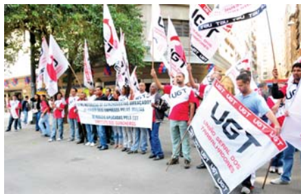
Pressão por direitos na Praça Ramos