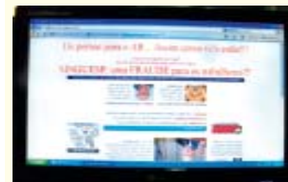
22 de setembro - Site do Sindicato foi adulterado por criminosos