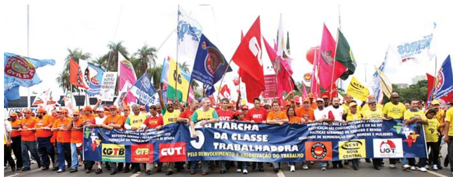
5ª Marcha da Classe Trabalhadora, em 2008, quando reuniu mais de 35 mil pessoas

Jornada - A data foi escolhida levando em conta a possibilidade de votação das 40 horas pela Câmara