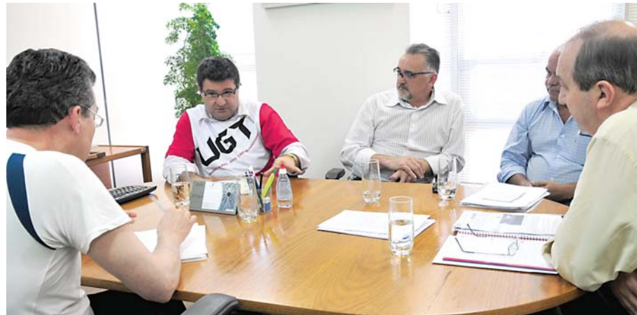
Presidente Chicão cobra dos representantes da CET e DSV soluções para os Guincheiros. Essa reunião só aconteceu após muita pressão do Sindicato

Atenção - Os Guincheiros só terão imunidade em multas de rodízio. Outras infrações serão cobradas normalmente. Os trabalhadores de municípios fora de São Paulo devem ligar para o Singuesp nos telefones (11) 3333.1893 e 3334.0733.